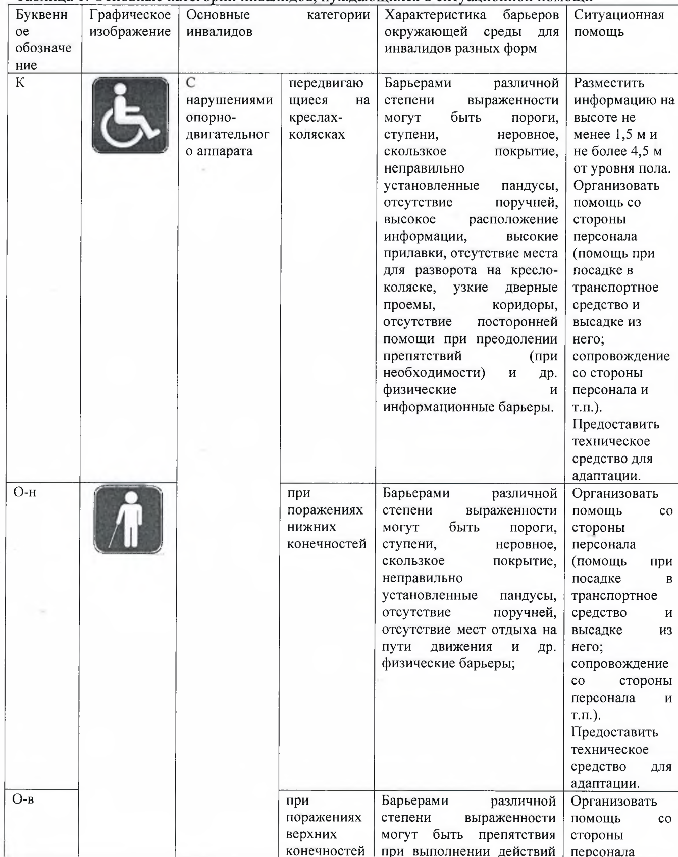
Таблица 1. Основные категорий инвалидов, нуждающихся в ситуационной помощи

3.2. С учетом основных видов нарушений, обуславливающих наличие значимых средовых барьеров, с которыми сталкиваются инвалиды, выделяют 8 категорий инвалидов. Основные категории инвалидов, нуждающихся в ситуационной помощи, представлены в таблице 1.